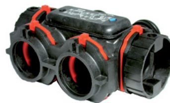
Байпас для Fleck 7700