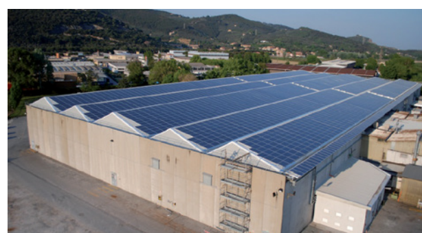
Производственная площадка Fleck в Пизе, Италия

Fleck Controls, Inc. была основана в США в 1950 году. В 1958 году она начала выпускать солевые клапаны и первый клапан для умягчения воды в 1963 году. В 1995 году Fleck был приобретен Pentair, мировым лидером в области высоких технологий, предлагающих инновационные решения для жилых, коммерческих и промышленных применений.