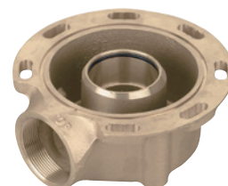
Поворотный боковой адаптер для 2850 или 2910